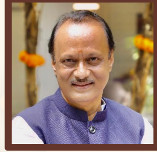
श्री. अजित पवार माननीय उप मुख्यमंत्री