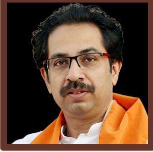
श्री. उद्धव ठाकरे माननीय मुख्यमंत्री