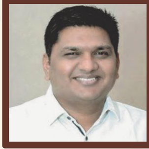
श्री. प्राजक्त तनपुरे राज्य मंत्री उच्च व तंत्रशिक्षण