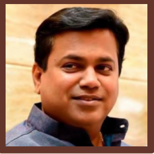
श्री. उदय सामंत मंत्री उच्च व तंत्रशिक्षण